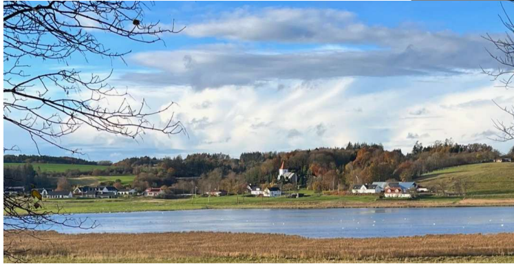
Gravlev by og sø