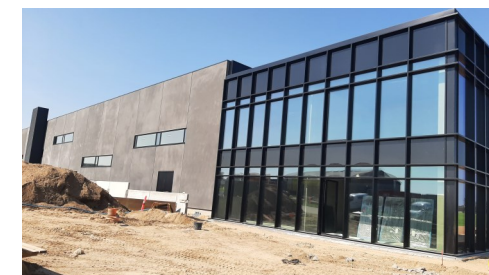
Den nye snusfabrik

Tid : Onsdag den 11. september 2024 kl. 19-21. Mødested : Medborgerhuset, Søndergade 15, Haverslev, 9610 Nørager. Pris : kr. 40 for Turistforeningens medlemmer, kr. 70 for ej-medlemmer. Børn 10-15 år halv pris og under 10 år gratis. Tilmelding : Ved køb af billet på www.derudad.dk eller pr. mail til info@rebildturist.dk senest mandag den 9. september kl. 12.