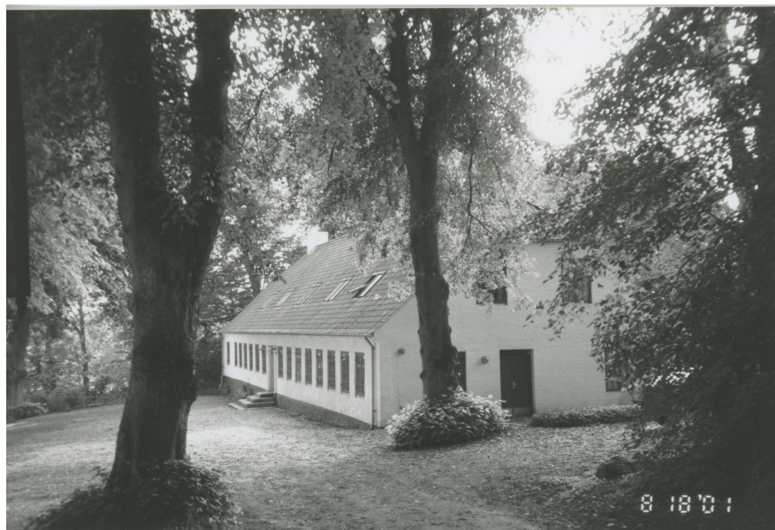
Nørgaard - tidligere herregård og herredskontor

Vi skal også forbi såvel den tidligere folkeskole og ungdomsskolen på vej tilbage til Bælum kirkes P-plads, hvor turen afsluttes.