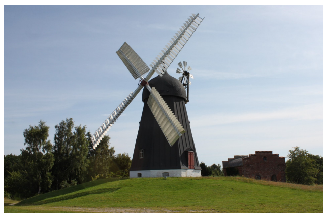
Den restaurerede Bælum Mølle år 2024

Vi starter turen ved P-pladsen ved Bælum Kirke , hvorfra vi går en rundtur i den nordlige del af Bælum. Vi skal se hvor den gamle vandmølle lå, gå gennem Bælum Nørskov til Bælum Mølle fra 1760'erne, som vi skal ind i.